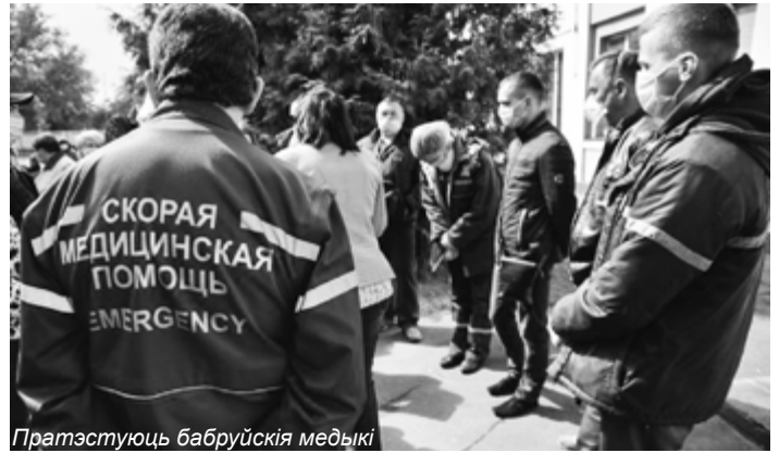
Працэстуюць бабруйскія медыкі

Увогуле хацеў бы заклікаць сваіх калегаў-медыкаў адчуваць сябе больш вольнымі, паважаць сваю годнасць, не маўчаць і не скакаць пад дудку кіраўніцтва. Улада без медыкаў не пражыве, а не наадварот.